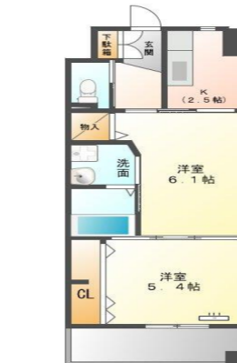
Dタイプ (34.1m 2 )