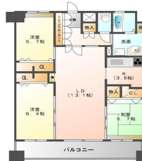
Gタイプ (77.6m 2 )