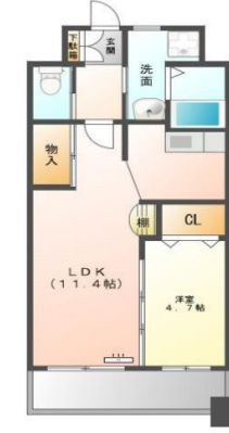
Bタイプ (38.6m 2 )