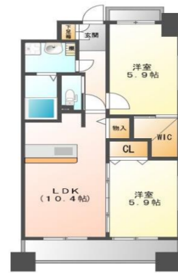
Aタイプ (51.7m 2 )