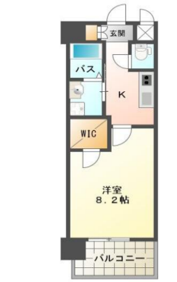
C1タイプ (28.52㎡) ※C2タイプ 間取り反転