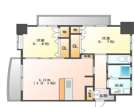
Fタイプ (55.1m 2 )