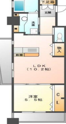
Fタイプ (55.1m 2 )