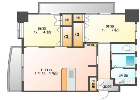
Gタイプ (77.6m 2 )