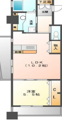
Eタイプ (40.7m 2 )