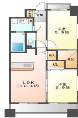
Aタイプ (51.7m 2 )