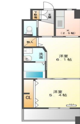
Dタイプ (34.1m 2 )